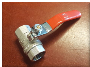
Kuglehane med langt greb (1/2 tomme)