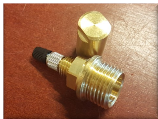
Pumpenippel med hætte (1/2 tomme)