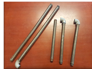
2 * 500mm rør (1/2 tomme) 3 * 200mm rør (1/2 tomme) 3 * vinkler (1/2 tomme)