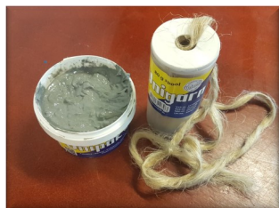
Pakningsgarn og pakningssalve