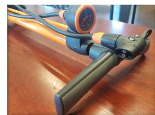
En god cykelpumpe