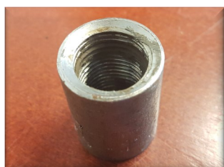
Overgang med muffe